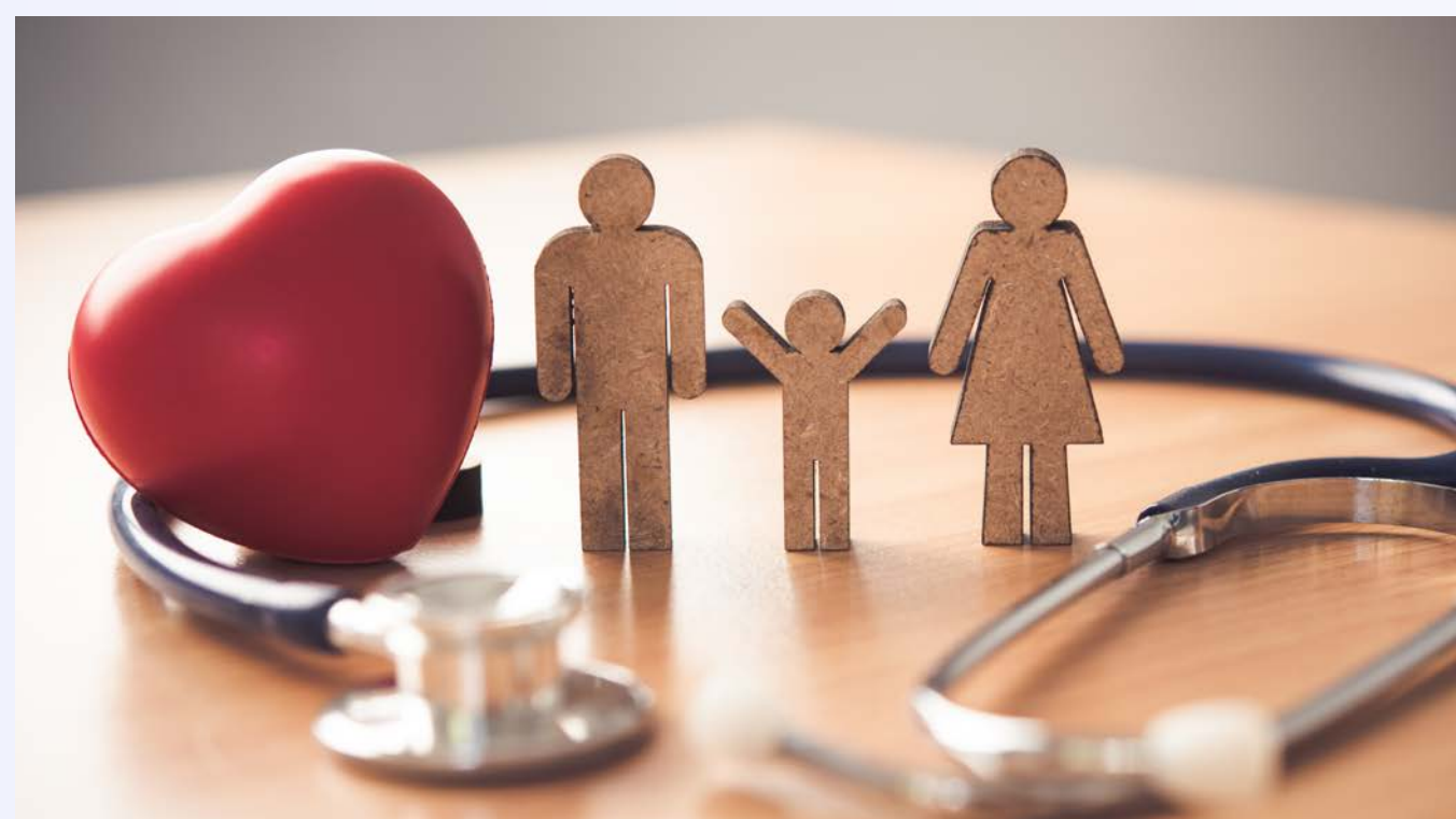
ДМС с возможностью застраховать 1 родственника за счет компании