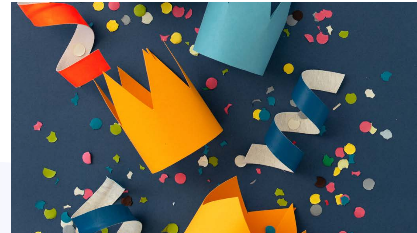
Премии при значимых семейных событиях (свадьба, рождение ребенка и т.п.)