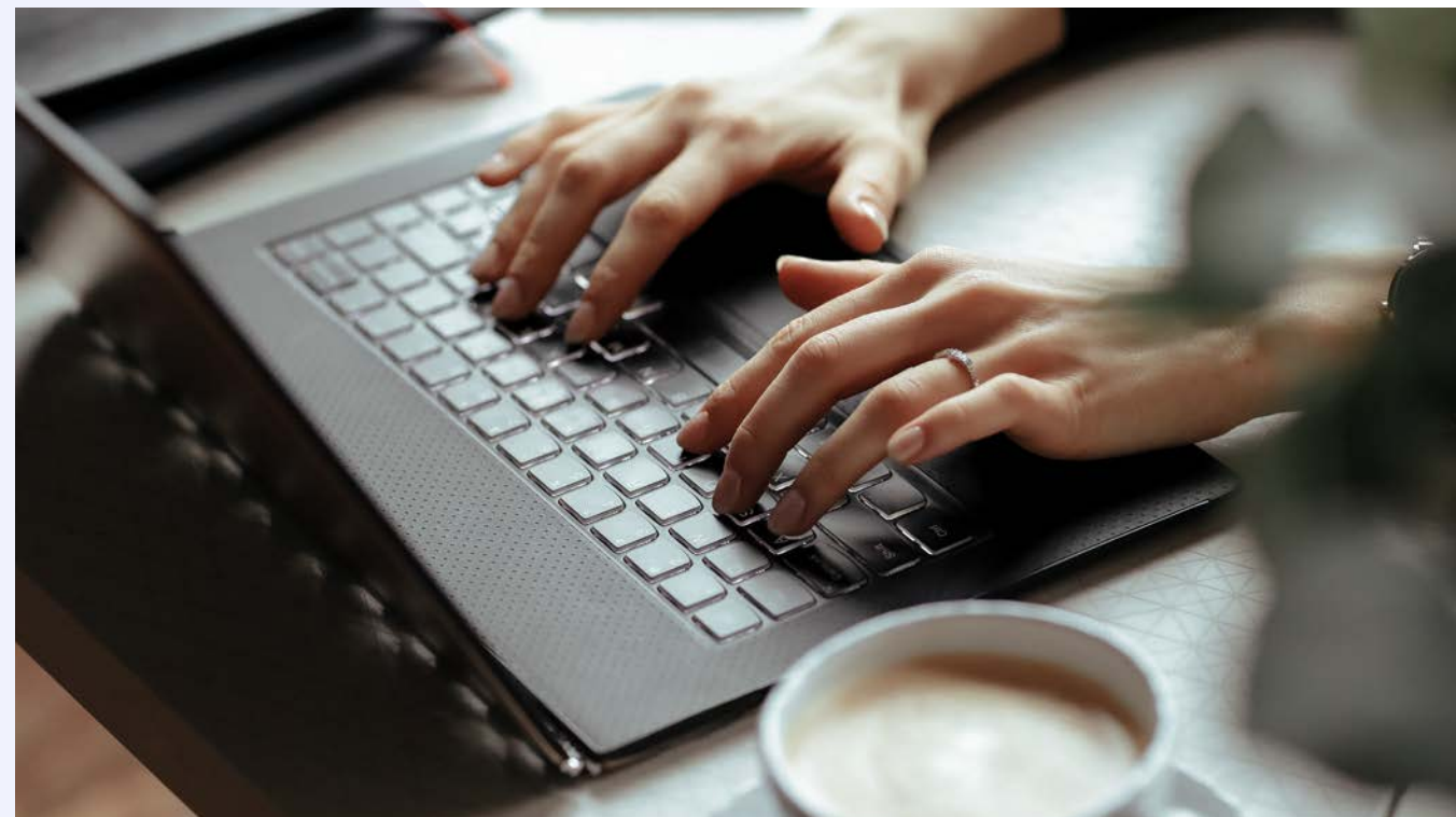
Программа оборудования домашнего рабочего места