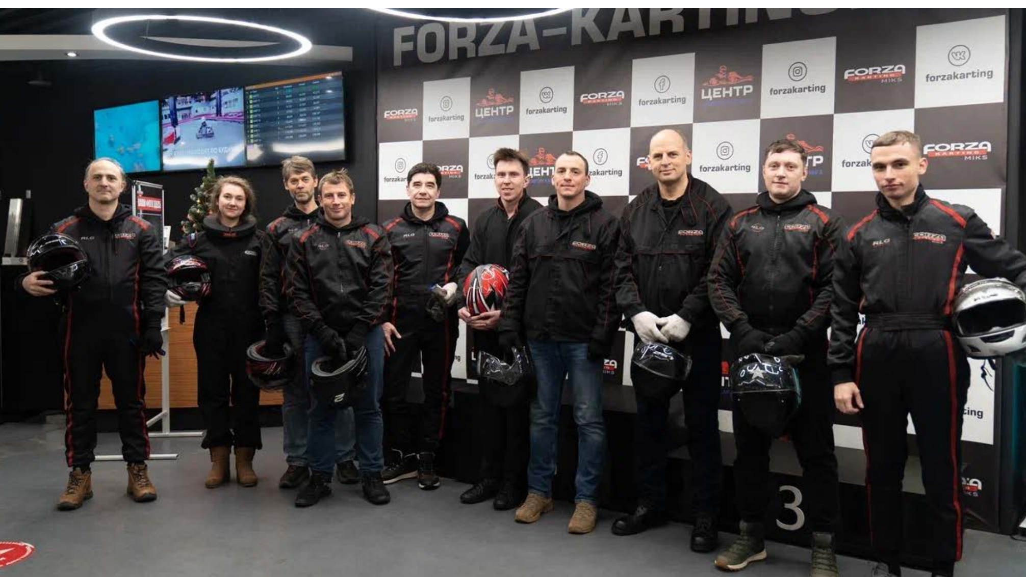
День Рождения компании